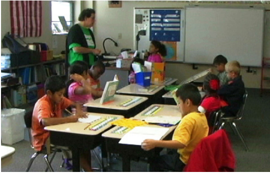
ابحث لتعرف إذا كان هناك جولات في المدرسة أو دورة تعريفية في الصيف قبل بداية المدرسة.