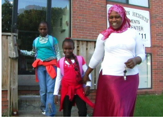
امش مع طفلك للباص أو للمدرسة.