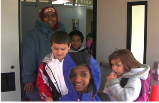
تطوع كمرافق في رحلة مدرسية.