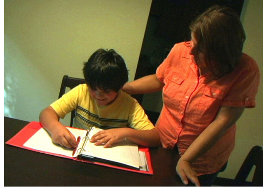
شارك مع طفلك بالعمل على الواجبات المدرسية.