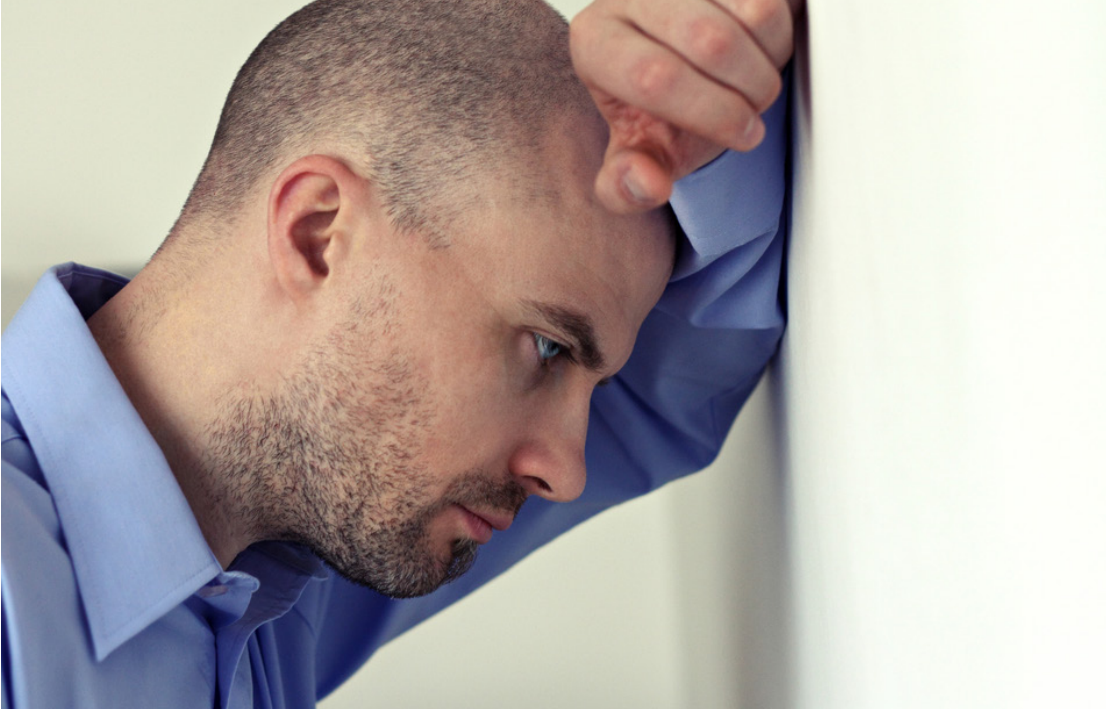
ربما تشعر بالاضطراب.