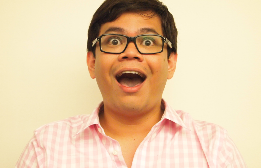
ربما تشعر بالسعادة الغامرة.