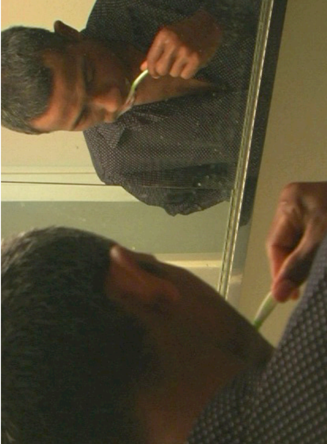
فرش أسنانك مرتين باليوم.