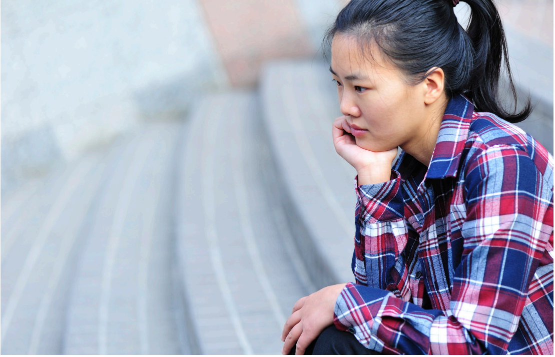
ربما تشعر بالوحدة أو العزلة.