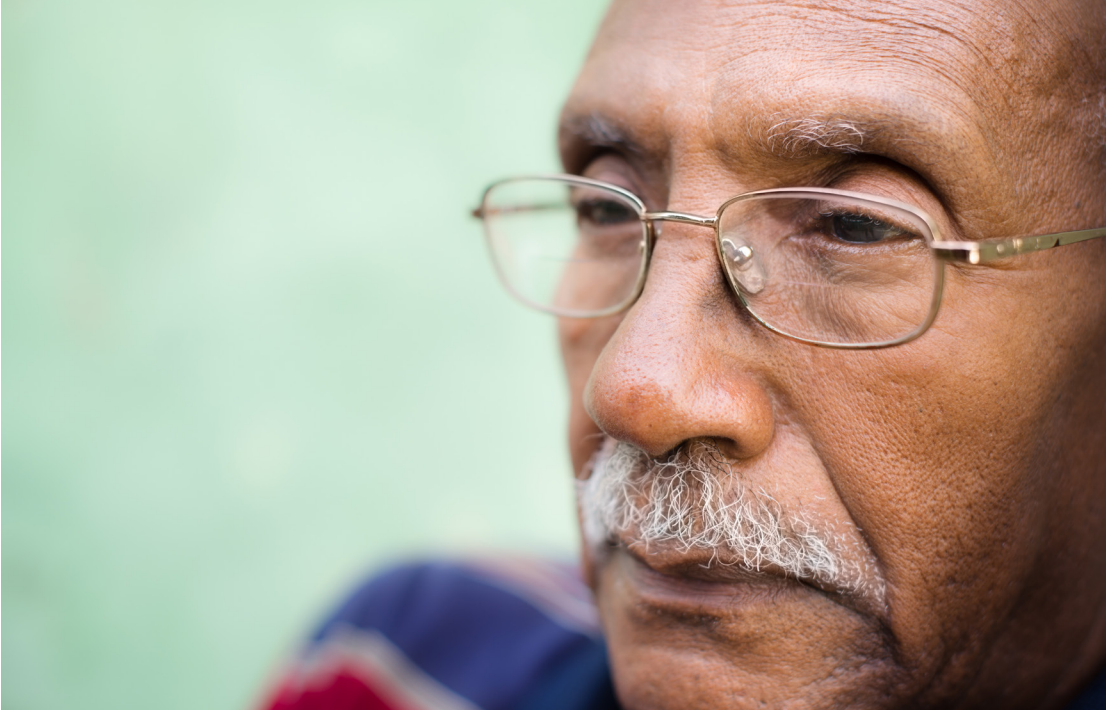
ربما تشعر بالحزن أو الكآبة.