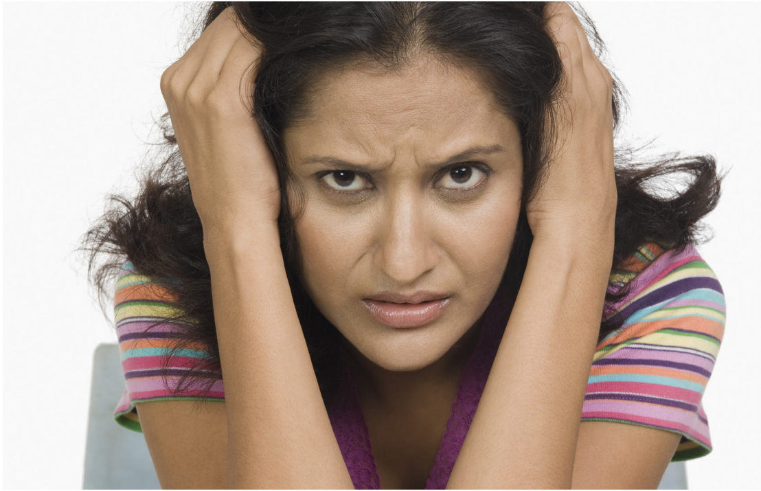
ربما تشعر بالإحباط.