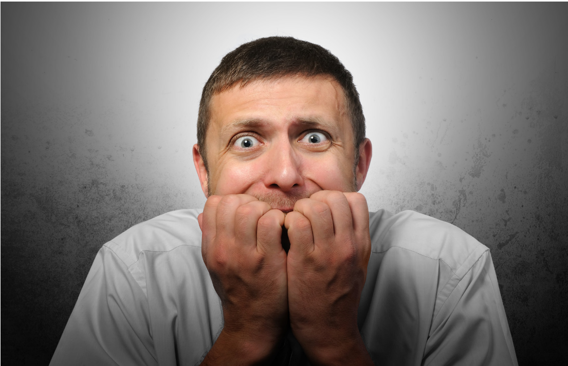
ربما تشعر بالقلق.