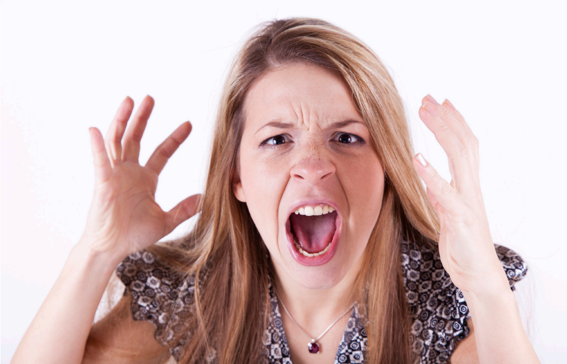
ربما تشعر بالغضب.