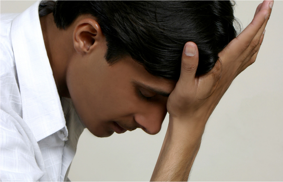
ربما تشعر بفقدان السيطرة على الأمور.