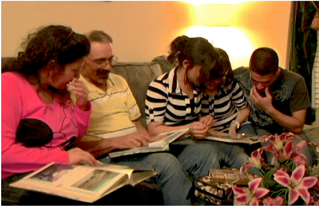
ربما تشعر بالحنين.