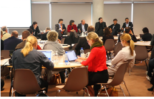
विद्यालयको संचालक समितिको बैठकहरुमा भाग लिनुस् ।