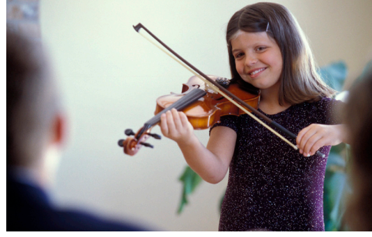
विद्यालयको विशेष कार्यक्रमहरु वा गतिविधिहरुमा भाग लिनुस् जस्तै विद्यालय विज्ञान -मेला, संगीत-गोष्ठी अथवा एउटा "अन्तर्राष्ट्रिय -दिवस" चाड ।