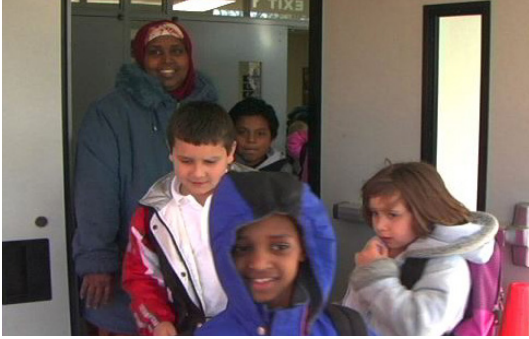
तपाईंको बच्चालाई फिल्ड ट्रिपमा लिएर जानुस् ।