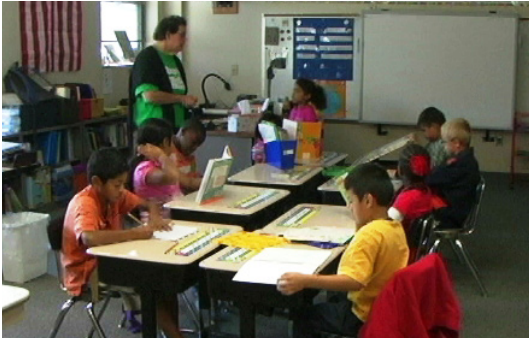
विद्यालय शुरु हुनुभन्दा पहिले गरीको विदामा विद्यालयले शैक्षिक भ्रमण वा एउटा अभिमुखीकरण कार्यक्रम प्रदान गर्छ वा गर्दैन पत्ता लगाउनुस् ।